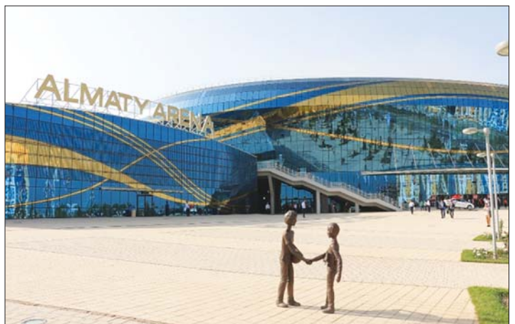
Жоғарғы суретте: Қазіргі Алматы қаласындағы Алматы арена стадионы