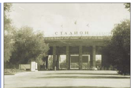
Төменгі суретте: Алматы қаласындағы Орталық стадион 1958 жыл