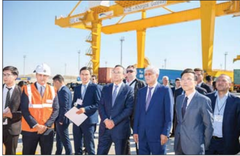
Қазақстан өңірлерін Қытай-Иран континентаралық магистральдарымен және Кавказ бен Ресей арқылы өтетін дәлізмен байланыстыру көзделіміз, – делі министр.

– Мемлекет басшысы Қазақстанды Еуразияның аса маңызды көліктік-логистикалық хабына айналдыру бойынша үлкен міндет қойды. Осы мақсатта біз Солтүстік-Оңтүстік, Шығыс-Батыс, Батыс Еуропа-Батыс Қытай дәліздерінің топшынады жұмыс істеуін қамтамасыз етуді, «Нұрлы жол» аясындағы жана экономикалық саясатты қытайлық «Бір белдеу – бір жол» бастамасымен үйлестірді, сондай-ақ