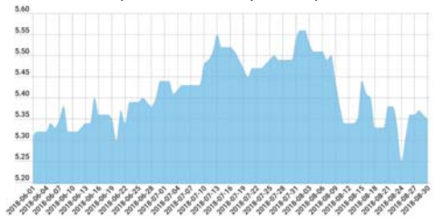
2018 жылғы маусым–тамыздағы рубльдің ресми бағамы (Ұлттық банк мәліметтері бойынша)

ралы Ұлттық банк бірнеше мәрте түсініктеме берді.