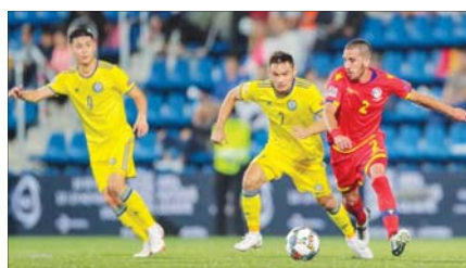
аяқталды. Нәтижесінде бірінші таймда есеп ашылмады.

Қазақстан ұлттық құрамасы Ұлттар лигасындағы екінші ойында Андоррамен сырт алаңда ойында. Пиреней түбегіндегі Испания мемлекетінің ішінде орналасқан қуыршақ мемлекеттің астанасы Андорра-ла-Велья қаласының «Андорра-ла-Велья» стадионында өткен кездесуде 1:1 есебі тіркелді. Қазақстан құрамасы ойында басымдығын алғашқы сәттерден ақ байқатты. Шабуылға сәт сайын ұмтылғанмен, алаң иелері қақпасына гол соғу мүмкін болмады. Барлығы бұрыштама добымен